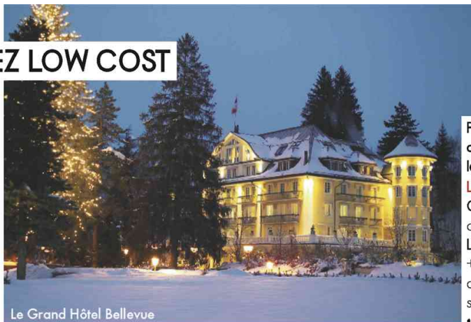
Le Grand Hôtel Bellevue