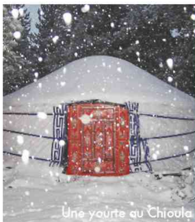
Une yourte au Chioula